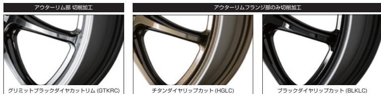
ブラックダイヤリップカット 15 (セミテーパー)