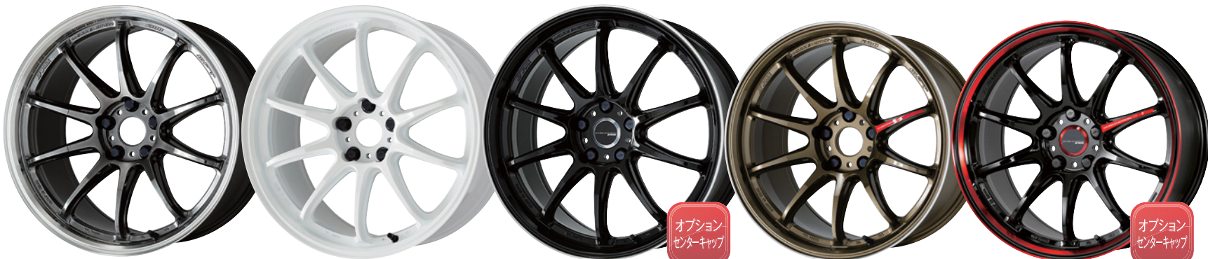
グリミットブラックダイヤカットリム 19 (ウルトラディープテーパー)